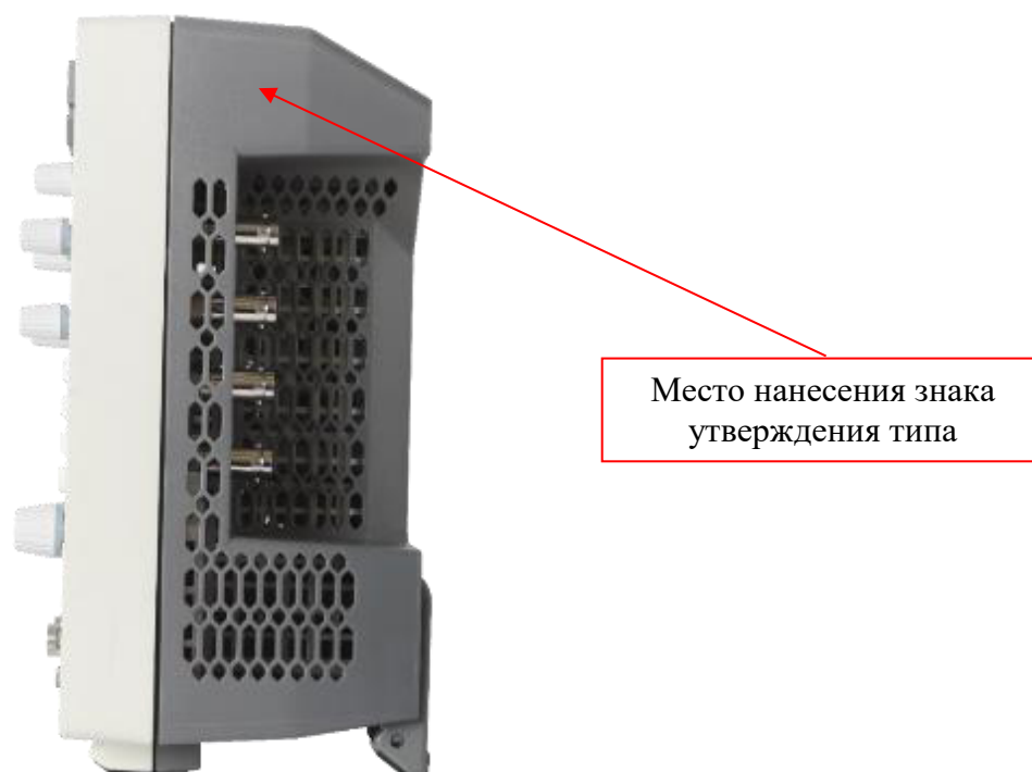
Рисунок 4 – Боковая панель осциллографов RIGOL DHO1ZZZ