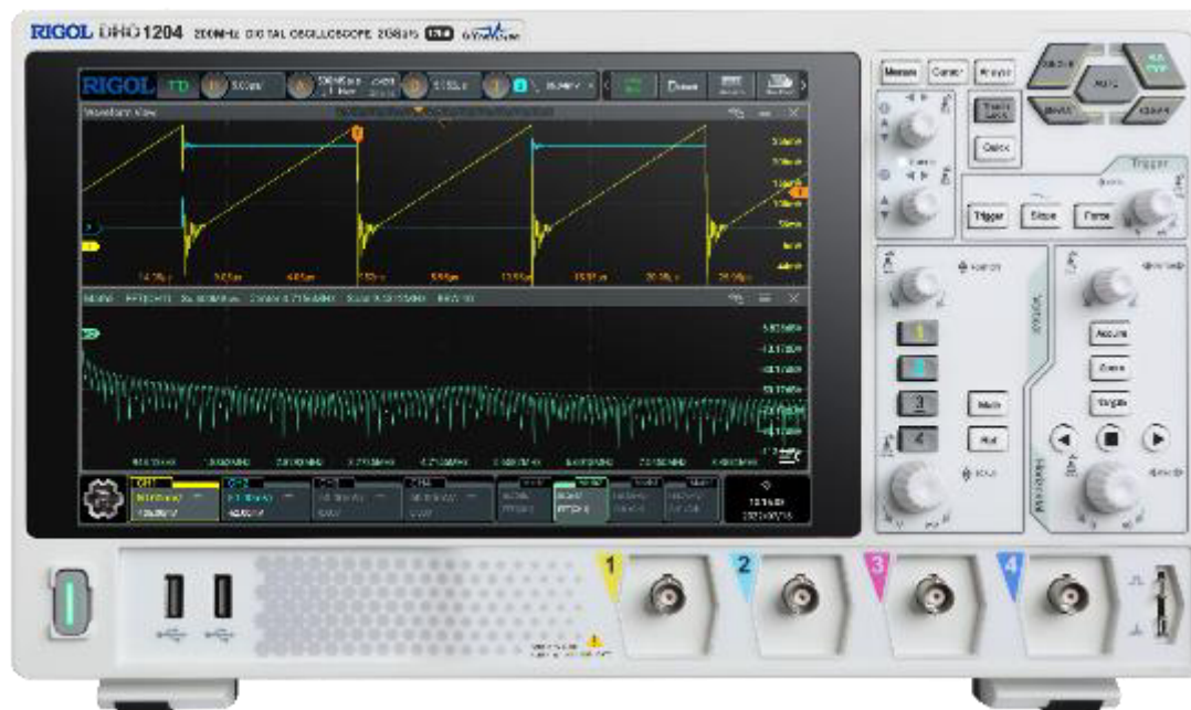
Рисунок 2 – Передняя панель осциллографов RIGOL DHO1074, DHO1104, DHO1204