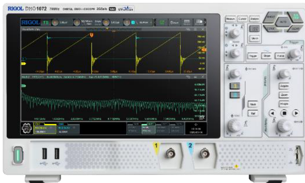
Рисунок 1 – Передняя панель осциллографов RIGOL DHO1072, DHO1102, DHO1202

Для предотвращения несанкционированного доступа к внутренним частям осциллографов осуществляется пломбирование нижней панели специальными стикер-наклейками.